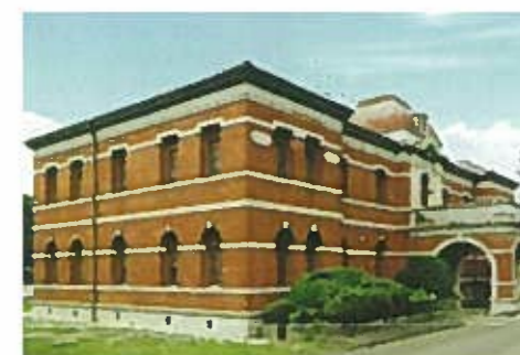
官営八幡製鉄日本事務所