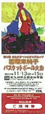
2015年大会スケジュール

ケットボール大会」を開催す るようになった歴史があります。 この大会のご招待券が二十 枚ほどありますので、ご興味 のある方は本社総務部藤本ま までお問い合わせください。