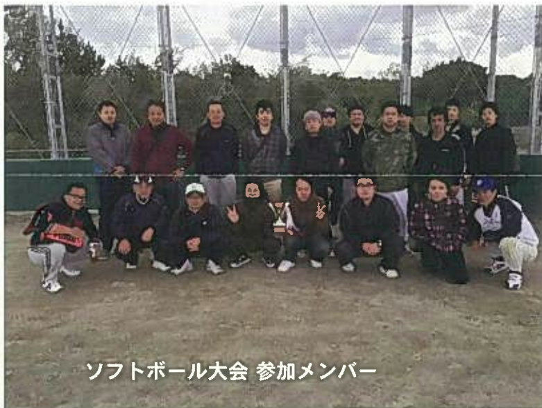
ソフトボール大会 参加メンバー