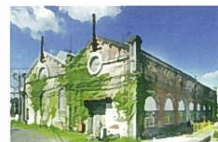
遠賀川水源地ポンプ室