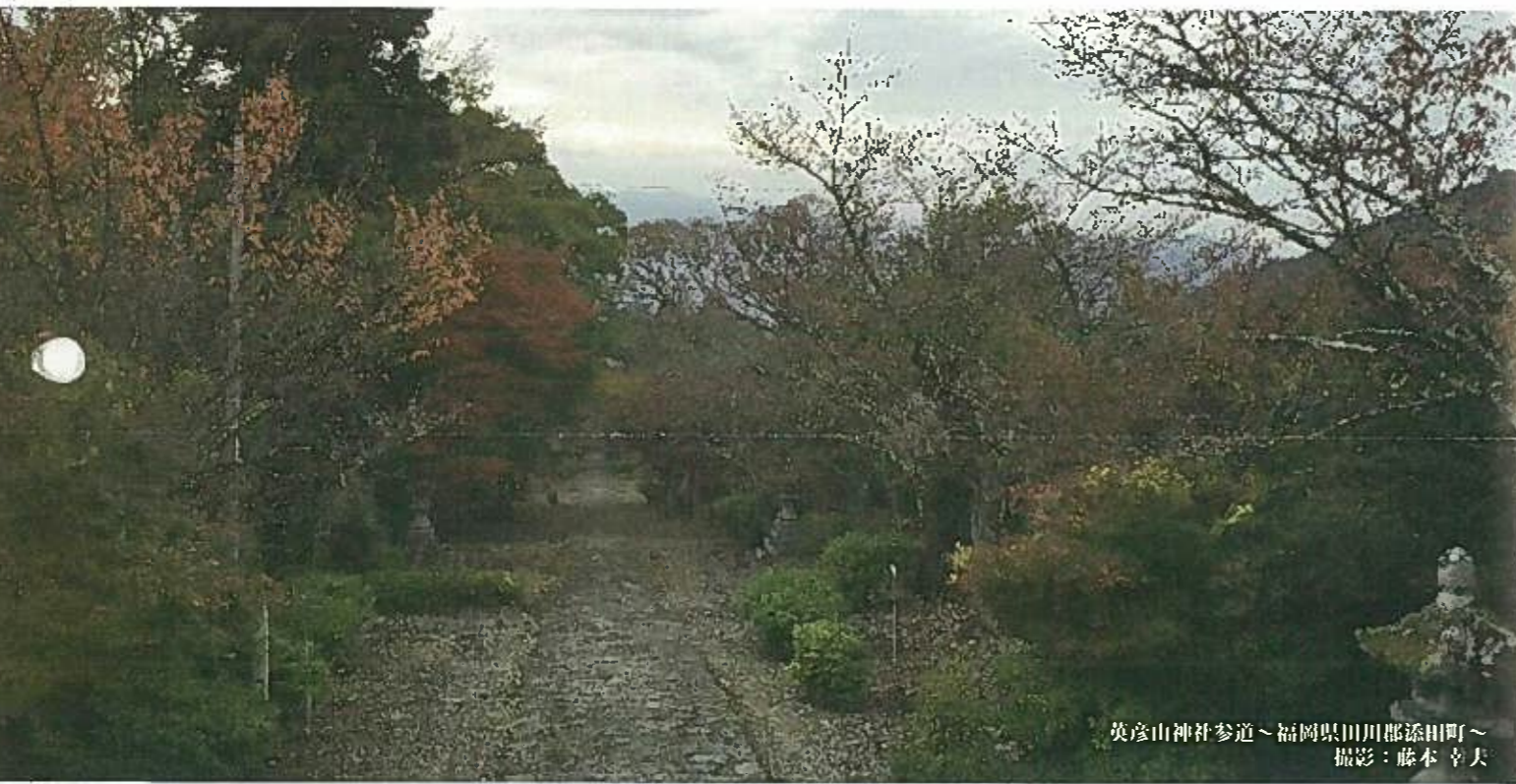
英彦山神社参道～福岡県田川郡添田町～